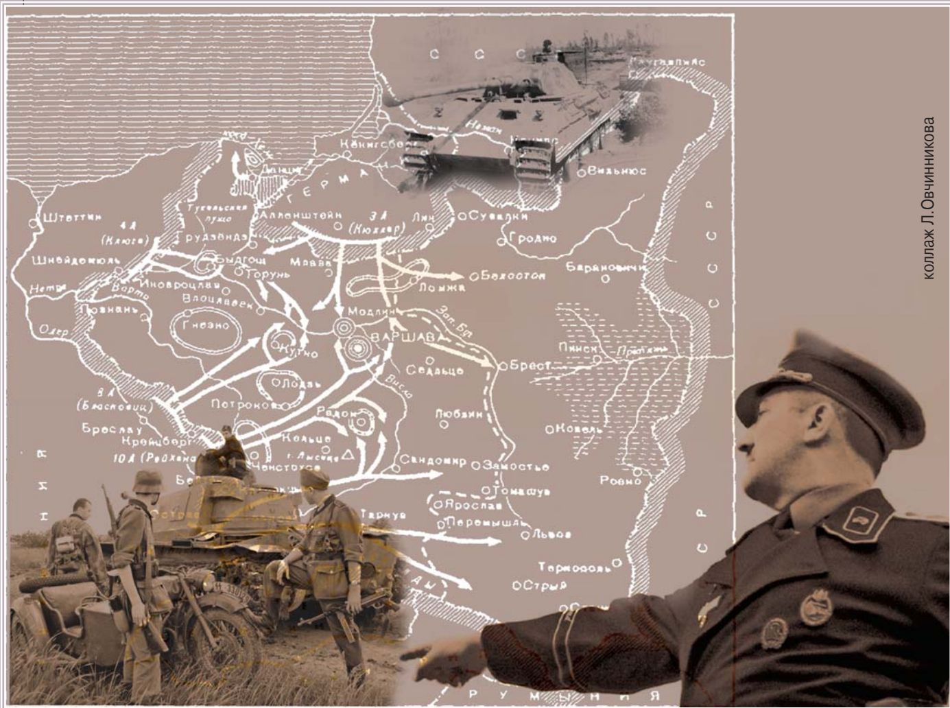
коллаж Л. Овчинникова

П асмурным утром 13 февраля 1939 года к запасным путям Берлинского вокзала маневровый паровоз подтянул два бронированных вагона. Прибытие этого небольшого состава вызвало бурное оживление среди присутствующих на перроне. Сотрудники СС, выставленные заблаговременно в оцепление, приняли положение «смирно», и даже натре-