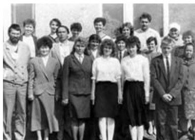
Выпуск Калиновской школы 1993 г.

РФ. Преподавательский состав учреждения постоянно участвует в районном конкурсе «Учитель года». Приоритетным направлением деятельности педагогического коллектива является реализация современных игровых, здоровьесберегающих, информационно-компьютерных и других технологий обучения. Педагоги активно используют теорию решения изобретательских задач, способствующую развитию интеллектуальных умений и навыков. Деятельность учителей направлена на решение задач по формированию личности, готовой к само-